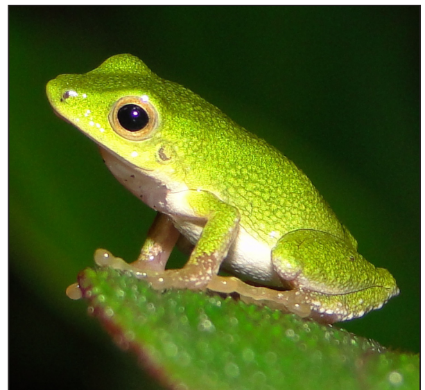
Figura 1. Macho adulto de Pristimantis ganonotus DHMECN 12270. LHC = 14 mm.

Los cantos se registraron con una grabadora digital Olympus (r) WS-802, acoplada a un micrófono direccional Sennheiser (r) ME 66-K6. La temperatura ambiente fue registrada con un termómetro Digital Flinn (r) ( \pm 1 °C). El análisis de los parámetros temporales se realizó con el programa Adobe Audition (r) CS6. Para los gráficos y análisis espectrales se uti-