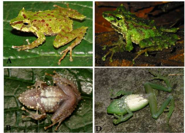
Figura 2: Coloración en vida de Pristimantis viridis y comparación con P. galdi . (A-B) vista dorsal y ventral del holotipo hembra de P. viridis (FHGO 6956, LRC 27.2mm); (C) vista dorsal de P. galdi , macho, Reserva Biológica Tapichalaca, Zamora-Chinchipe, ejemplar no colectado, (D) vista ventral de P. galdi , macho DHMECN 5607, Río Verde, Tungurahua.

tatarsal externo redondeado y prominente, aproximadamente un tercio el tamaño del interno; tubérculos plantares supernumerarios escasos y poco evidentes; dedos de las patas con bordes laterales; disco del dedo I del pie poco dilatado, dedos II a V muy dilatados; almohadillas y cubiertas de los discos redondeadas (Fig. 1A); extremo del dedo V del pie no alcanza al borde proximal del tubérculo subarticular del dedo IV; dedo III del pie alcanza el borde distal del penúltimo tubérculo subarticular del dedo IV.